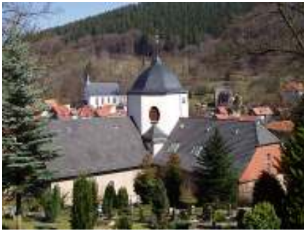
Blick auf die Kirche von Südwesten

Da Ruhla während der Weltkriege weitgehend verschont geblieben ist, wurde auch die St. Concordia-Kirche nicht in Mitleidenschaft gezogen. Somit ist sie die einzige, die seit ihrer Erbauung unverändert im Originalzustand erhalten blieb.